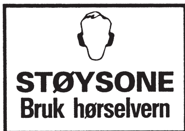
Fig. 15 Varselskilt for støysoner

Innretninger som kan gi høyere lydnivå enn 85 dB(A) på operatørens plass, skal være tydelig merket av leverandør/ produsent. Det kan også være så sjenerende støy i andre områder at hørselvern bør brukes. Bruk hørselvern dersom støyen virker irriterende eller gir øresus, dotter i ørene eller hodepine.