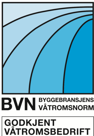
Fig. 81 Logo for ordningen «Godkjent våtromsbedrift i henhold til BVN»

Godkjenningen varer i fem år. I denne perioden vil bedriften stå oppført i FFVs liste over godkjente våtromsbedrifter på www.ffv.no , og bedriften kan markedsføre seg med BVNs logo med påskriften «Godkjent våtromsbedrift», se fig. 81.