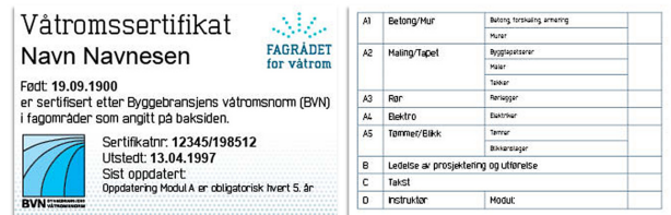
Fig. 34 Eksempel på sertifikat

Alle som har bestått eksamen i modul A, tildeles kursbevis og sertifikat for vedkommendes fagområde. Eksempel på sertifikat er vist i fig. 34. Sertifikatet er gyldig i fem år.